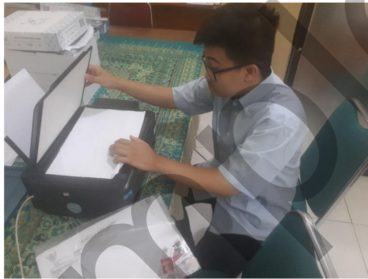
Gambar 4. Scan data calon peserta

Tugas yang selanjutnya diberikan kepada penulis dalam proses rekrutmen adalah melakukan scan data calon peserta program pendidikan kecakapan kerja. Data yang penulis scan antara lain foto, KTP dan KK (Kartu Keluarga). Data-data tersebut dilakukan scanning karena menyesuaikan bentuk dari file yang harus di upload kedalam sistem informasi milik Kementerian Pendidikan dan Kebudayaan.