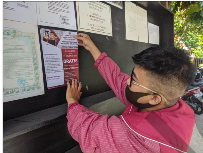
Gambar 2. Penyebaran brosur

Tugas berikutnya yang penulis lakukan dalam proses pelaksanaan rekrutmen adalah melakukan pendataan calon peserta yang telah mendaftar program PKK. Penulis melakukan input berdasarkan KTP atau KK dari calon peserta program. Data tersebut penulis input kedalam aplikasi excel yang nantinya akan digunakan untuk proses rekrutmen peserta tahap berikutnya.